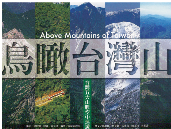
▲ 行政院 蘇院長參加鳥瞰台灣山及台灣山林空中散步新書發表會。