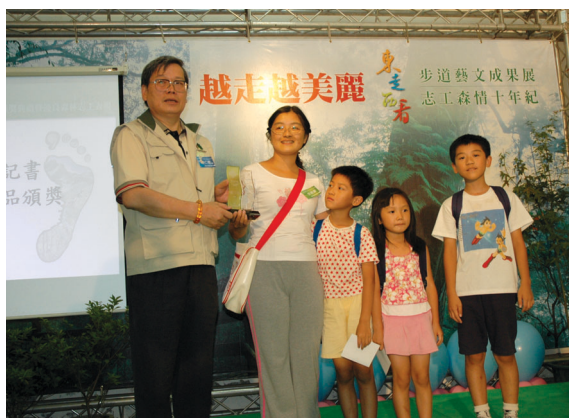
▲ 提倡「徐行·輕裝·簡食·寧靜」步道系列推廣活動，筆記書得獎親子組之頒獎。