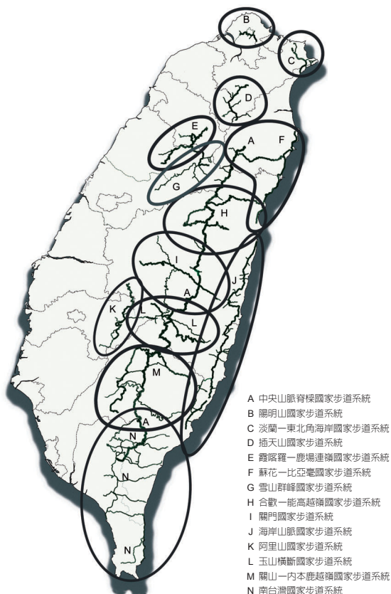
圖2 國家步道系統示意圖。

級步行體驗廊道，其步道本身除應具備台灣地區自然人文資源或景觀美質的代表性外，並應能提供國民生態旅遊、自然體驗、環境教育、休閒遊憩、與景觀欣賞等機會」。由此而來之國家步道有別於一般縣市或相關單位的地區性步道，其遴選考量有二方面：1. 在潛力因子方面：（1）具台灣地區自然資源代表性。（2）具台灣地區文化歷史代表性。（3）具台灣地區景觀美質代表性。2. 在限制因子方面：（1）對遊憩利用的限制。（2）對生態環境之衝擊。並需經審慎勘察遴選並由政府代表及專家組成的發展推動小組指認，能提供生態旅遊、自然體驗、環境教育、休閒遊憩、景觀欣賞等機會。