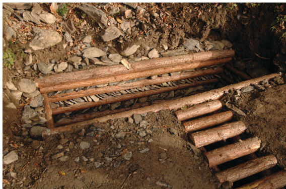
▲96年1月初於霞喀羅古道辦理之生態工作假期，志工施作步道集水設施與導溝情形與完成成果。