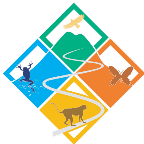
▲區域步道識別標章。

編印「鳥瞰臺灣山」及「台灣山林空中散步」等整體介紹山林、步道之專書、發行步道導覽地圖及多處步道摺頁、解說手冊等。辦理步道空中攝影展及計畫執行成果展覽，提供國人透過圖文，瞭解步道系統建置發展內容並宣導永續發展、山林保育、環境倫理等主題。針對步道規劃準則、施工維