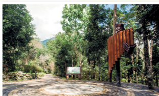
景觀步道-共鳴入口意象

全長約426公尺，步行約45分鐘，沿途經吾名台東區、季風穿林區、原民之森區、山莊、水流腳底按摩區…等主要設施據點，是一條適合小朋友、年長者行走的輕鬆步道。