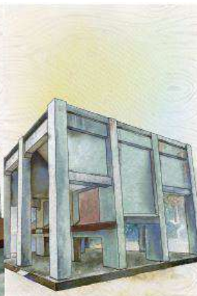
- 鋸屑室 -

1913年完工，製材所電力皆來自於動力室的火力發電系統，透過當時先進的設備讓製材流程達到自動化。RC建築，挑高跨距設計，為嘉義市定歷史建築。