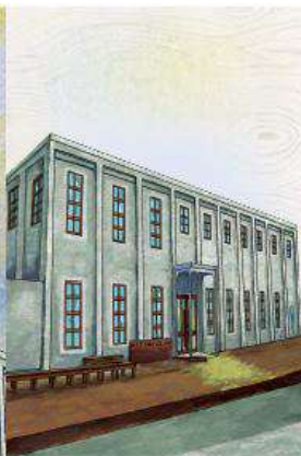
- 動力室 -

1913年完工，製材所電力皆來自於動力室的火力發電系統，透過當時先進的設備讓製材流程達到自動化。RC建築，挑高跨距設計，為嘉義市定歷史建築。