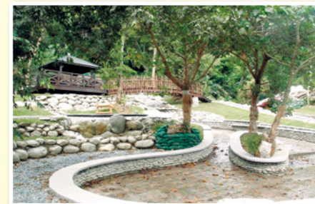
水流腳底按摩步道

引導終年不斷的山泉水，提供遊客有益健康的按摩步道。當踩踏在泉水流過的圓卵石上，清涼舒爽的快意，令人忘卻夏日的煩熱。