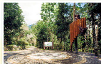
景觀步道-共鳴入口意象

步行時間約45分鐘。沿途經吾名台東區、季風穿林區、原民之森區、山莊、水流腳底按摩步道及嬉遊林間區…等主要設施據點。是一條適合小朋友、年長者行走的輕鬆步道。