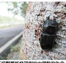
仔細觀察能發現樹林中躍動的生命。

妨攜帶解說資料或圖鑑，邊騎邊邊認識它們；尤其林中鳥鳴嘈切切，不時會聽到此起彼落、互相應答的鳴唱，或傳遞訊息、或求偶，十分有意思。也有機會在林間發現昆蟲，比如正在樹幹上吸食樹汁的蚜蟲或是獨角仙、蝴蝶等等。