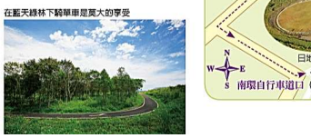
在藍天綠林下騎單車是莫大的享受

從服務中心往北、往南規劃有筆直寬闊的「北環道」與「南環道」，環道中還鋪設了蜿蜒曲折，可供尋幽探秘的自行車道，不論筆直大道或蜿蜒小徑，都是柏油鋪成的路面，平整好騎，可依時間選擇長度適中的路線騎乘。