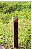
車道上可見定向樁。

騎單車也能玩「定向運動」！定向運動可分個人與團體，根據個人體能與年齡，還分為親子、辦公室人員、有運動習慣者三級級別，可以健身、練腦力又考驗耐力，家族或同學組團玩「定向」，也是不錯的另類聯誼。使用定向專用地圖與指北針，不管是單槍匹馬還是一大票，都可以進入園區好好闖一闖！