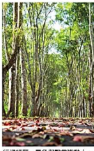
行道紅葉，黃色與聲音皆動人。

大農大富平地森林園區範圍大、地勢平緩、路面寬闊平整，到這裡瀟汗甩卡路里是非常過癮的選擇。假如天氣好，騎在自行車道上，沿路都是悉悉簌簌飄過落葉的清脆聲響，聒噪或秀氣的鳥鳴聲不時傳來，不但肌肉達到運動效果，皮膚沐浴在涼風中，連耳朵都能享受到頂級的天籟音響，心靈與身體都能盡情地舒展開來。