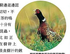
樹林裡最有活力的就是牠們！