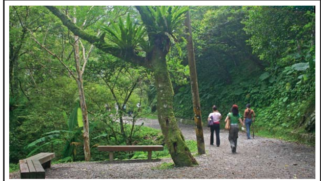
森林中植物散發的芬多精，可以讓空氣清新，還可達到殺菌的功能

綠色森林中充滿著上天的恩賜：清新的空氣、舒爽的氣候、自然的音韻以及優美的景緻。置身於綠境叢林中，除了讓人心曠神怡外，林木發散出來的芳香精氣，結合森林浴場，亦提供現代人最天然的健身房。森林中的林木，會釋放氧氣，並散發可以殺菌、淨化人體的芬多精 ...more