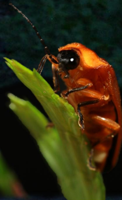
大端黑螢 Abscondita anceyi