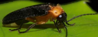
黑翅螢 Abscondita cerata

活動費用請於中心寄發「匯款通知書」一周內匯款， 住宿費則依照訂房網站公告之費用，採當天至現場繳 給遊客中心。