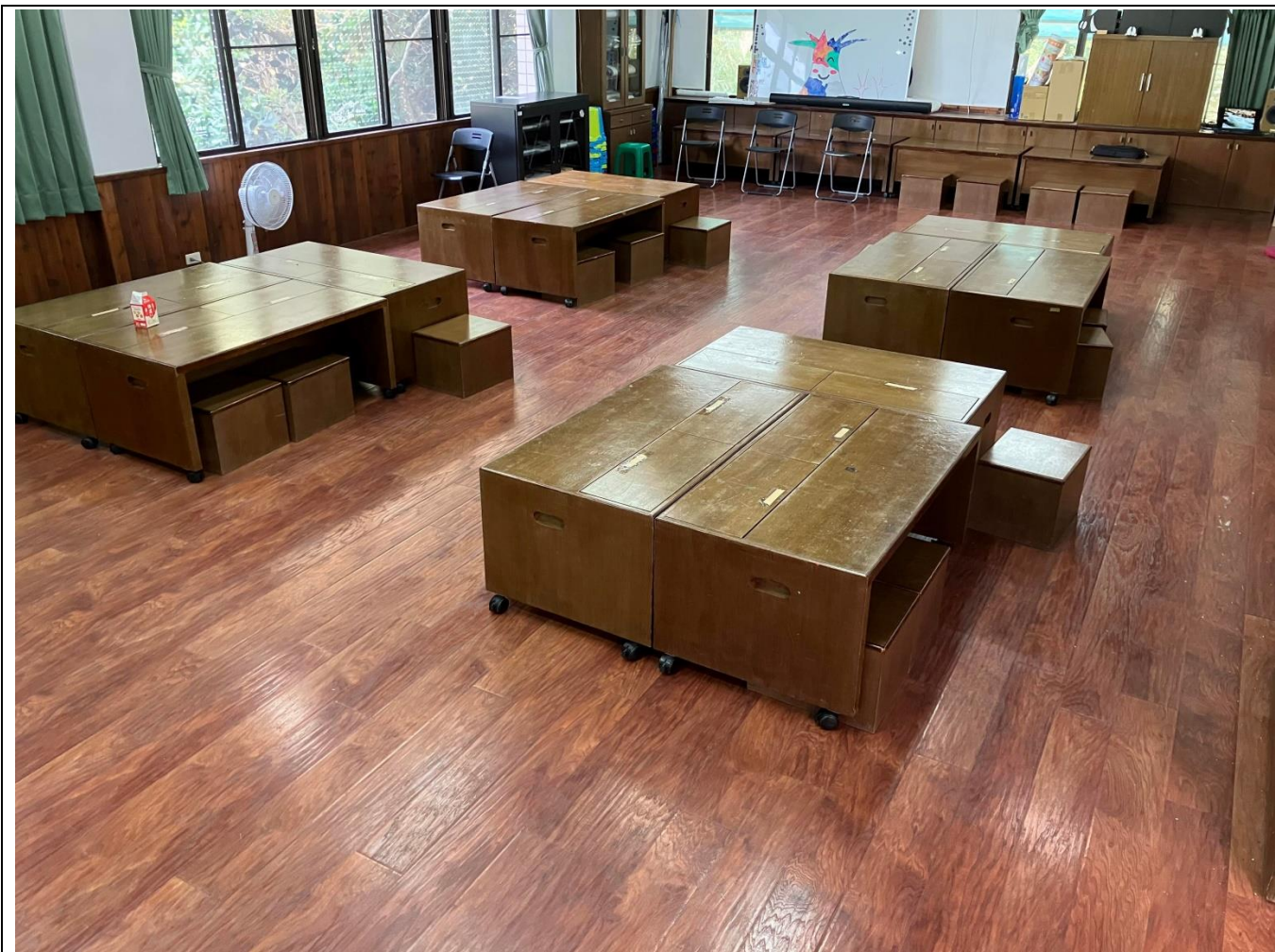
中心二樓探索屋教室空間