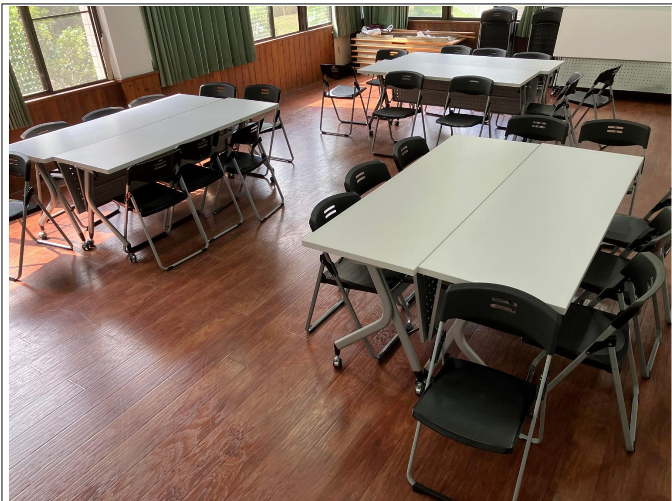
中心二樓野趣屋教室空間