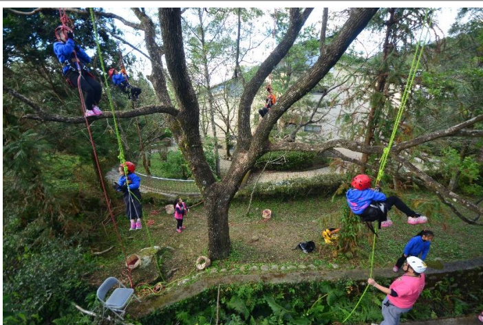
行政管理中心週邊